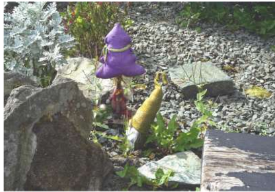
Passanten und Freude am Leben in den steinigen Garten. Silmaril erwartet uns.

Auf dem Rückweg springt mir wieder einmal eine lustige Gartendekoration ins Auge! Mit so wenig zaubern diese Figuren ein Schmunzeln auf die Gesichter von