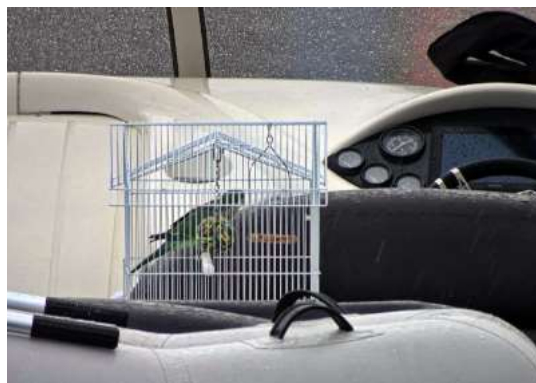
13:50. Wir wollen noch Tarbert erreichen. Abschied von Ardrishaig: gute Erinnerun-

Auf dem Ponton zwitschert etwas: auf einem Gummiboot steht ein winziger Käfig, der arme Vogel hat wenig Aussicht, bloss enge Stäbe! Wer transportiert diesen armen Kerl auf einem Gummiboot! Es ist